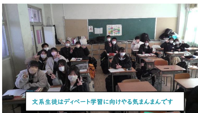
文系生徒はディベート学習に向けやる気まんまんです