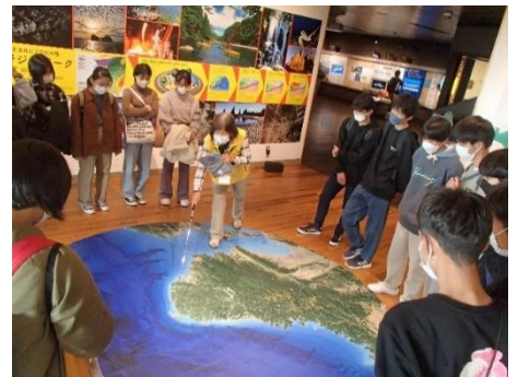
南紀熊野ジオパークセンターでの様子