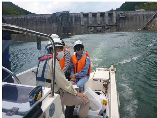
大滝ダムの湖上視察